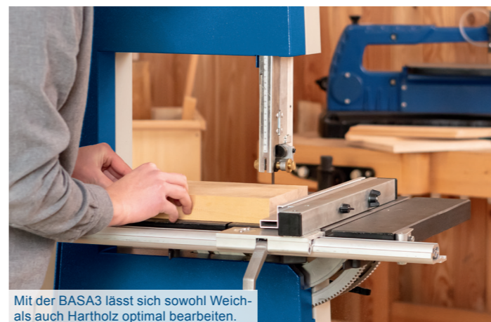
Mit der BASA3 lässt sich sowohl Weich- als auch Hartholz optimal bearbeiten.