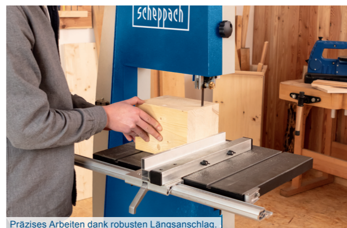
Präzises Arbeiten dank robusten Längsanschlag.