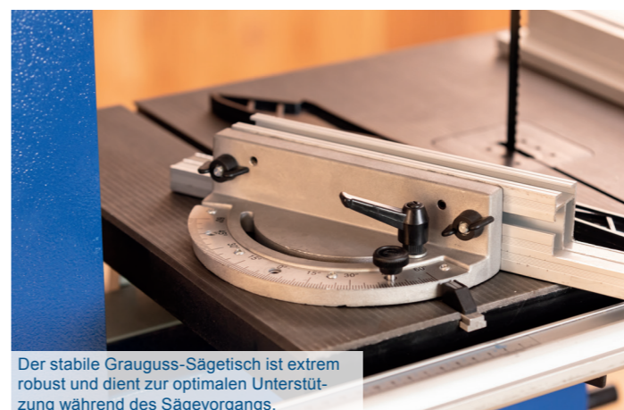
Der stabile Grauguss-Sägetisch ist extrem robust und dient zur optimalen Unterstützung während des Sägevorgangs.