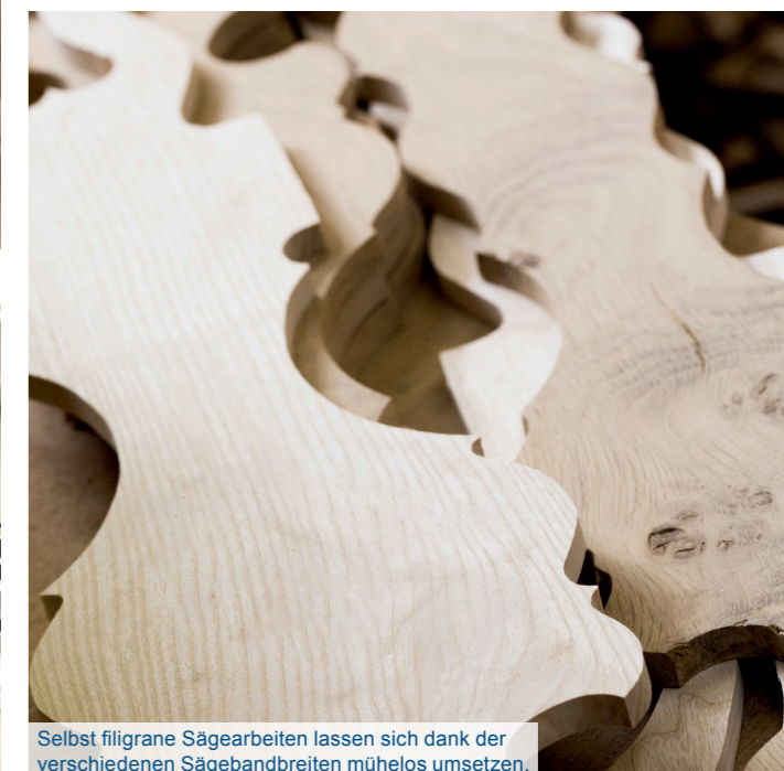
Selbst filigrane Sägearbeiten lassen sich dank der verschiedenen Sägebandbreiten mühelos umsetzen.