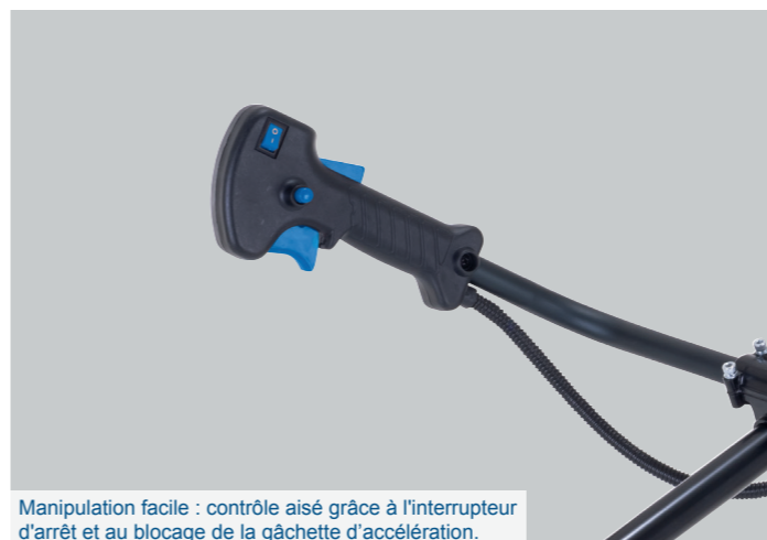
Manipulation facile : contrôle aisé grâce à l'interrupteur d'arrêt et au blocage de la gâchette d'accélération.