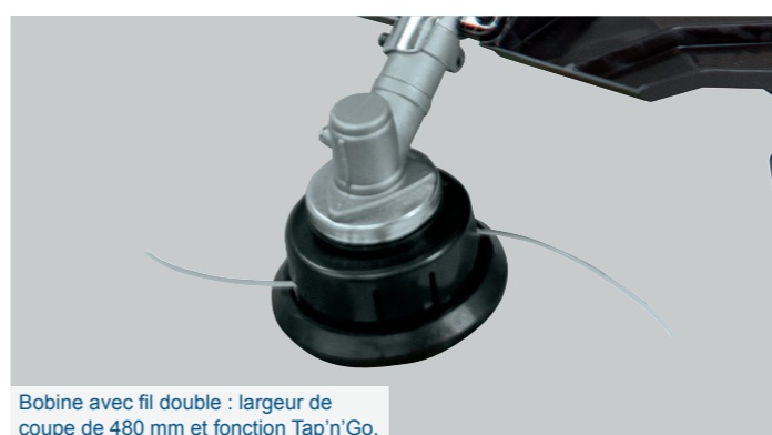
Bobine avec fil double : largeur de coupe de 480 mm et fonction Tap'n'Go.