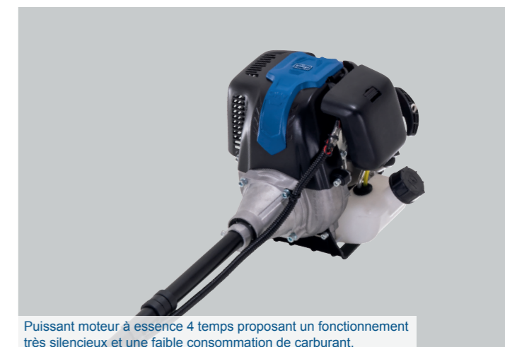
Puissant moteur à essence 4 temps proposant un fonctionnement très silencieux et une faible consommation de carburant.