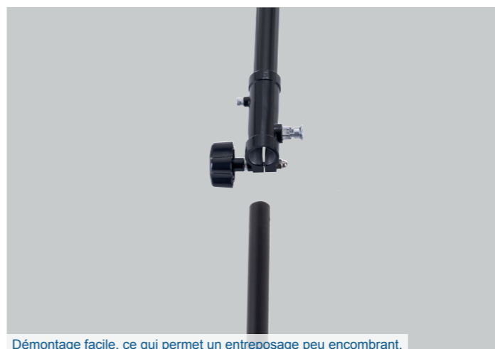
Démontage facile, ce qui permet un entreposage peu encombrant.