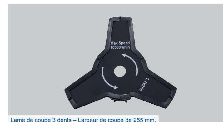
Lame de coupe 3 dents – Largeur de coupe de 255 mm.