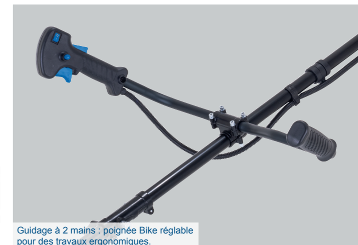
Guidage à 2 mains : poignée Bike réglable pour des travaux ergonomiques.