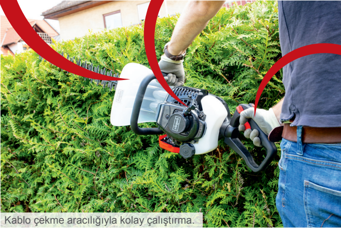
Kablo çekme aracılığıyla kolay çalıştırma.