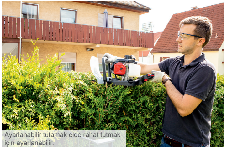
Ayarlanabilir tutamak elde rahat tutmak için ayarlanabilir.