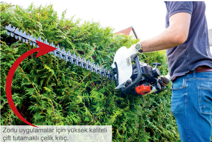
Zorlu uygulamalar için yüksek kaliteli çift tutamaklı çelik kılıç.