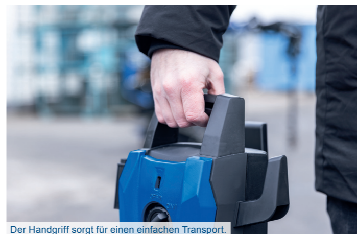
Der Handgriff sorgt für einen einfachen Transport.