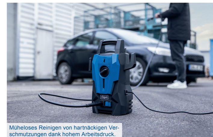
Mühesloses Reinigen von hartnäckigen Verschmutzungen dank hohem Arbeitsdruck.