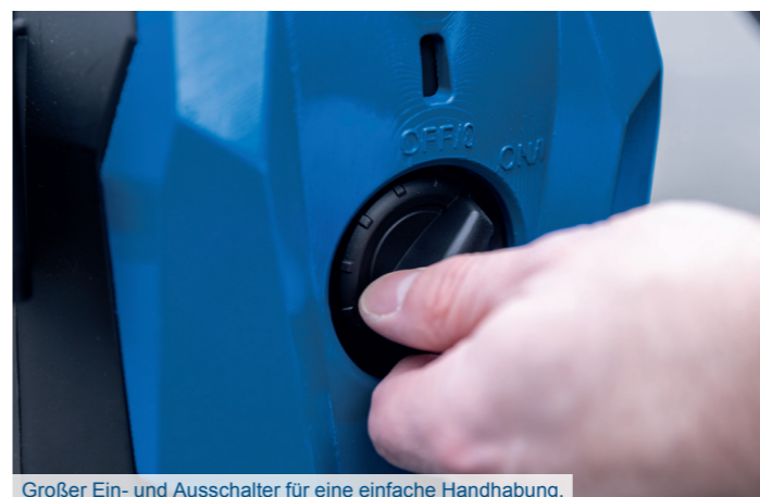
Großer Ein- und Ausschalter für eine einfache Handhabung.