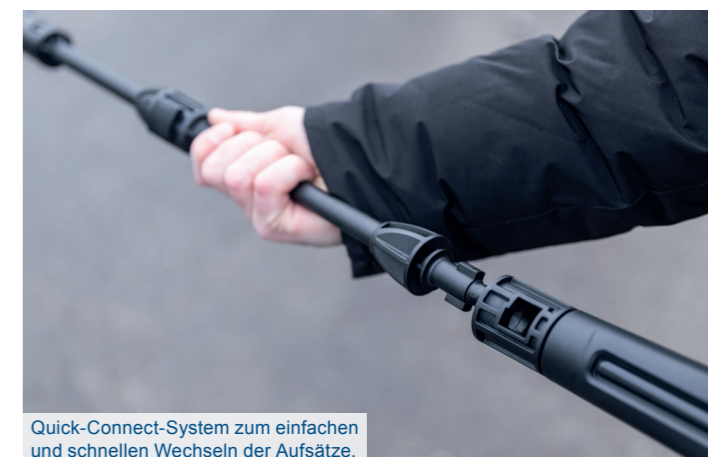
Quick-Connect-System zum einfachen und schnellen Wechseln der Aufsätze.