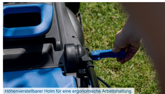
Höhenverstellbarer Holm für eine ergonomische Arbeitshaltung.