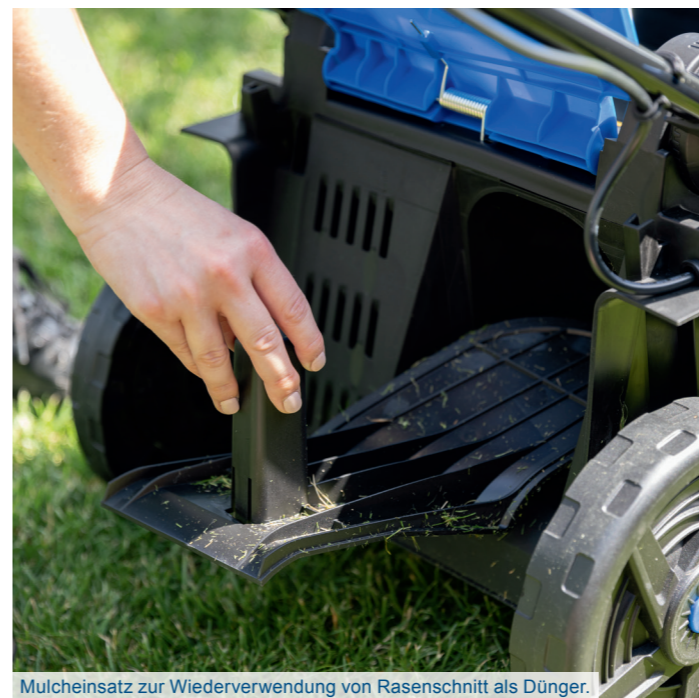
Mulcheinsatz zur Wiederverwendung von Rasenschnitt als Dünger.