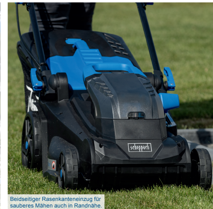
Beidseitiger Rasenkanteneinzug für sauberes Mähen auch in Randnähe.