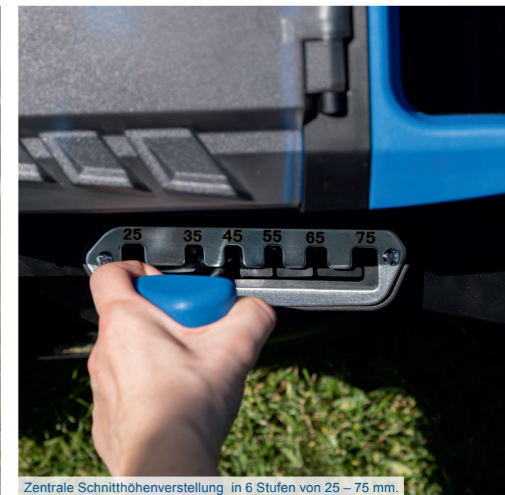
Zentrale Schnitthöhenverstellung in 6 Stufen von 25 – 75 mm.

Laufzeit und Leistung können durch äußere Gegebenheiten variieren