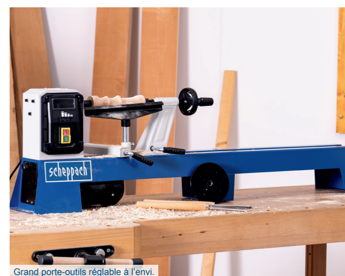
Grand porte-outils réglable à l'envi.