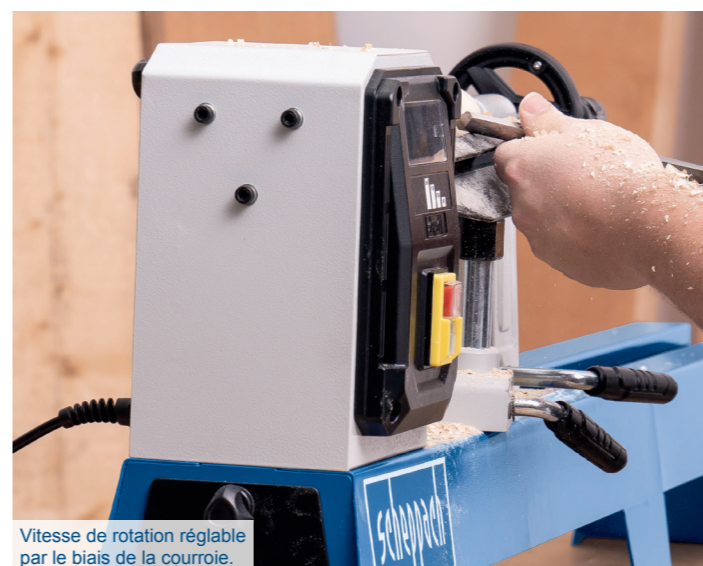
Vitesse de rotation réglable par le biais de la courroie.