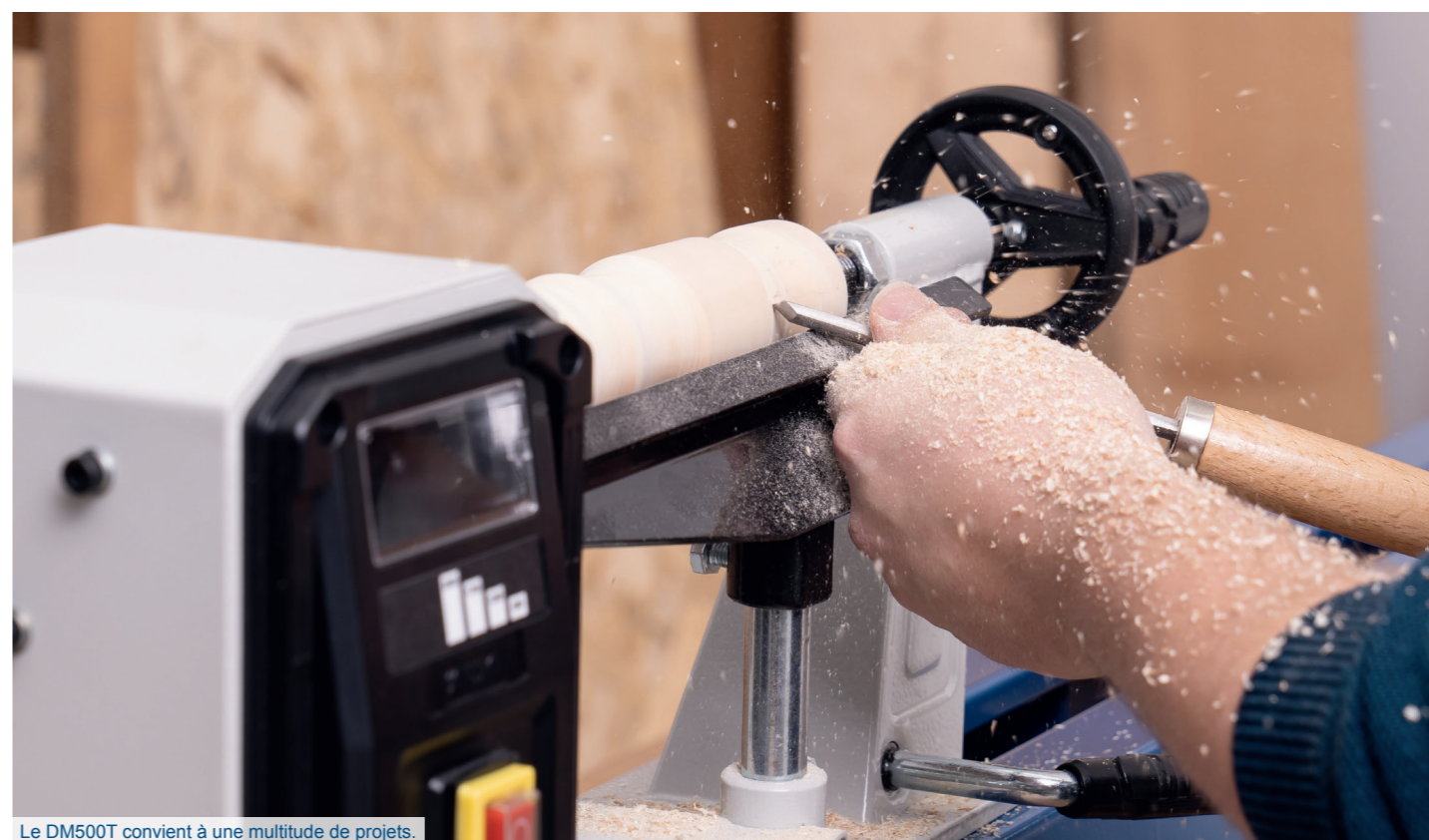
Le DM500T convient à une multitude de projets.