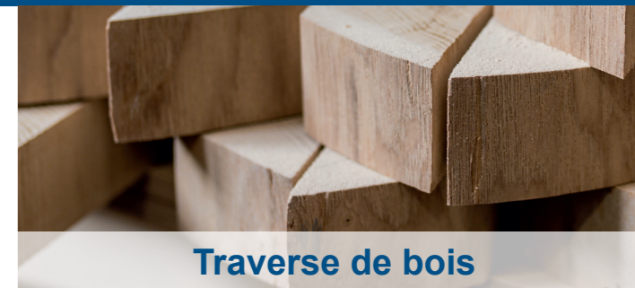
Traverse de bois